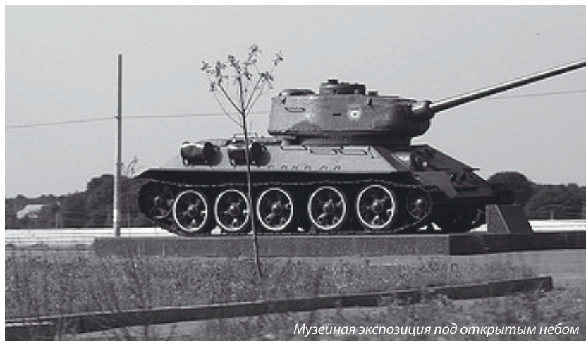
Музейная экспозиция под открытым небом

Чуть более 5% от общего числа адвокатов специализируются на арбитражном процессе и сопровождении предпринимательской деятельности. Как правило, ими