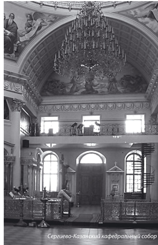
Сергиево-Казанский кафедральный собор

же учреждаются от 1 до 3 фирм, оказывающих юридические услуги.